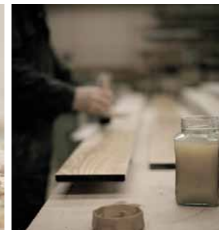
Realizzazione mobili in legno naturale oliato.