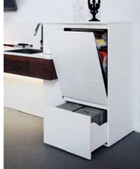
Blocco multifunzione con lavastoviglie posizionata alta da terra in modo ergonomico.