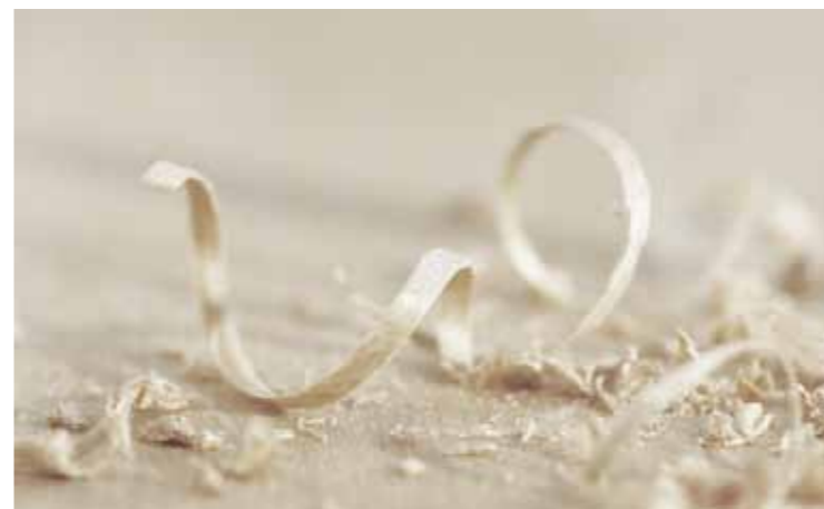
Minor consumo di materia prima.