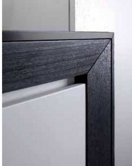
Unione a 45° del montante verticale con quello orizzontale inclinato verso l'interno, "un' invito" a facilitarne l'apertura.