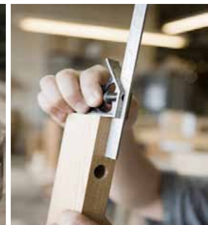
Soluzioni "su misura".