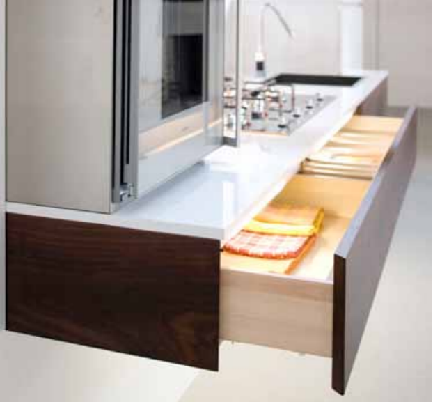
Cassettone retroilluminato con meccanismo Blum per estrazione totale e sistema Blumotion che rallenta la chiusura.