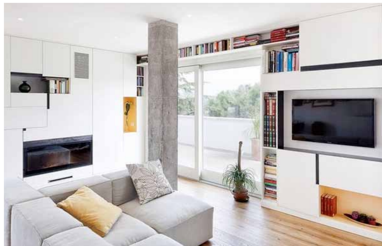
Progetto d'arredo per appartamento a S. Donà di Piave (Ve) ripensato nel taglio degli ambienti e riqualificato in chiave ecosostenibile.